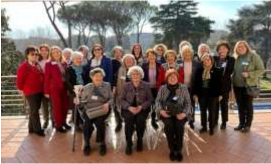
Gennaio Convenzione Nazionale