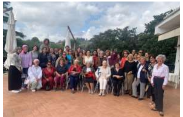
Settembre Caffè di benvenuto con le mogli degli addetti