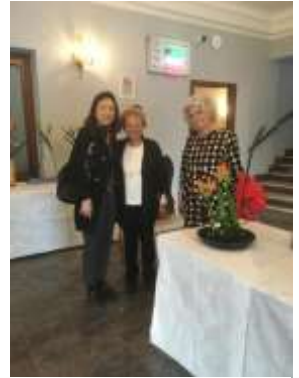
Marzo Anniversario 20 anni del corso di Ikebana Tre Emme