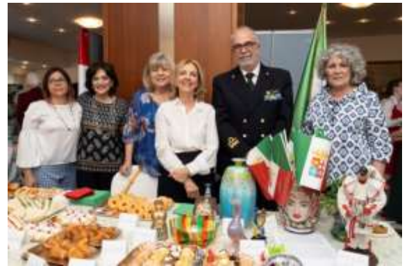
Maggio International Day