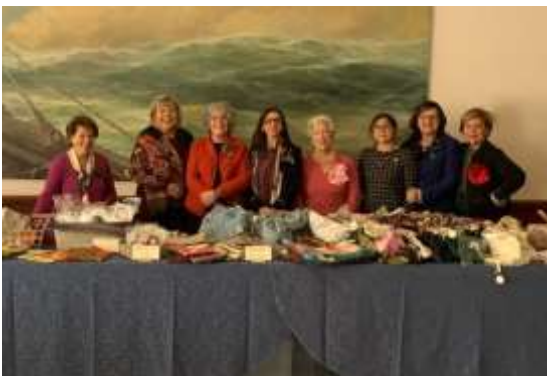
Novembre Mercatino di Natale