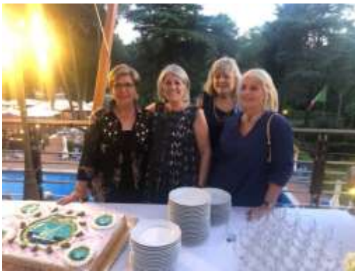
Giugno Festa d'estate