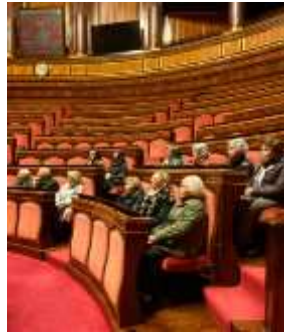
Febbraio Visita al Senato